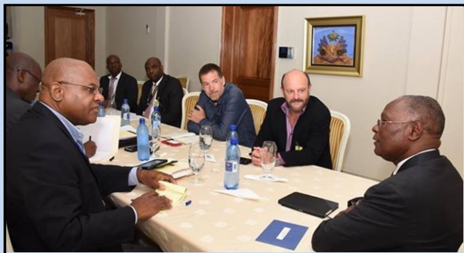
Rencontre sur la lutte anti-contrebande